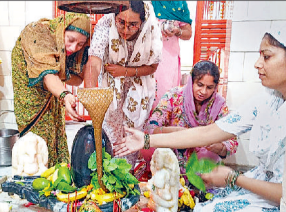
सोनीपत। नरेंद्र नगर स्थित शिव मंदिर में पूजा करती श्रद्धालु।

मंदिरों में महिलाएं और पुरुष हाथों में गंगाजल, बेलपत्र, धतूरा, दूध और पुष्प लेकर कतार में खड़े नजर आए