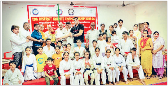
गोहाना। अतिथिगणों व आयोजकों के साथ विजेता खिलाड़ी।