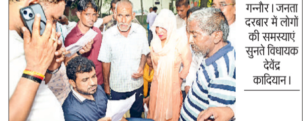
सामुदायिक भवन की मांग रख

विधायक देवेंद्र कादियान ने सोमवार को देवा सोशल वेलफेयर सोसायटी कार्यालय में जनता दरबार लगाया। इस दौरान क्षेत्र के लोगों की करीब 230 समस्याओं की सुनवाई हुई। विधायक ने सभी शिकायतों को अधिकारियों के सामने रखा और समाधान के निर्देश दिए। लोगों ने बिजली, पानी, गांवों की सड़कों की मरम्मत, पीएम आवास की लंबित किस्तों और विकास कार्यों से जुड़ी समस्याएं रखीं। शहर के वार्ड 6 के लोगों ने गली नंबर 5 में पानी की पाइप लाइन बिछाए जाने की मांग की। गढ़ी केसरी के लोगों ने