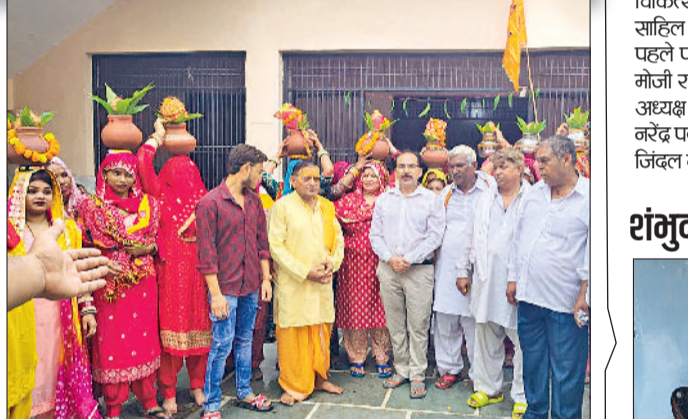
सोनीपत। कबीरपुर के शिव मंदिर में आयोजित कार्यक्रम में श्रद्धालुगण।