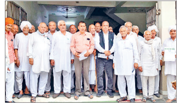
भारतीय किसान यूनियन (अम्बावाला ग्रुप) की बैठक के दौरान मौजूद किसान ।